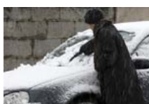
Genève sous la neige ce week-end