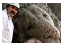
Nettoyage du «lion agonisant» à Lucerne