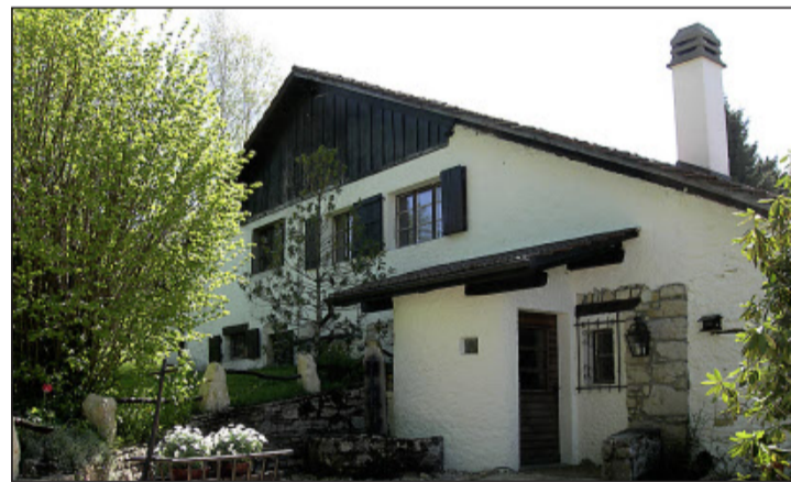
L'Auberge de La Braconne se trouve dans le village jurassien du Prédame, près des Genevez, dans les Franches-Montagnes.